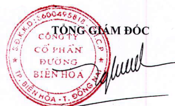
Trần Quế Trang